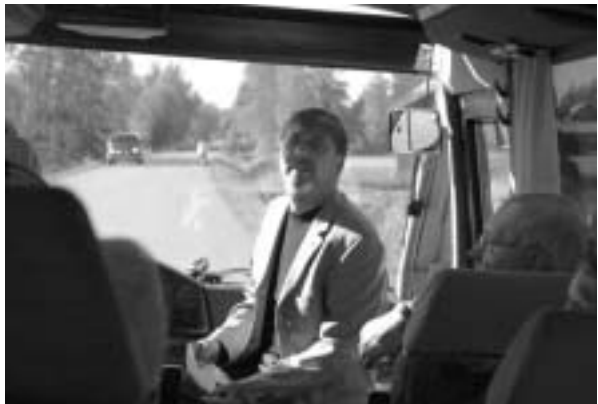
Tarmo oppaana kohti Kokonkylää.

Kauhajoen, nykyisen 14.000 asukkaan kaupungin, keskusta on väljä. Pienteollisuuden ja liik-