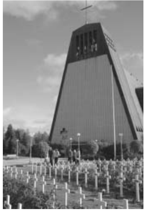
Kukkienlasku. Kauhajoen kirkko ja sankarihautausmaa. Yhteiskuva sunnuntaina koolla olleista.