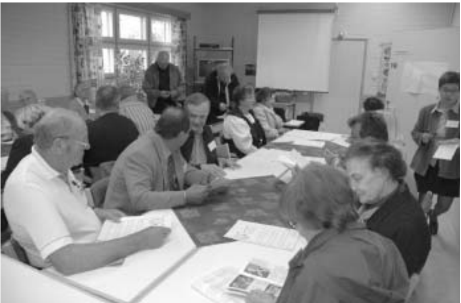
Laululla tietysti aloitettiin.